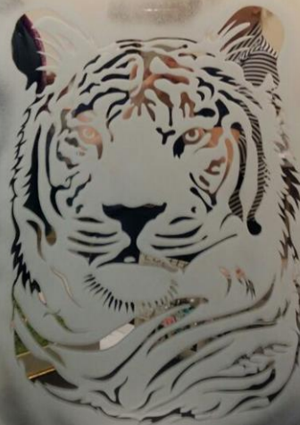
Пескоструйный рисунок на зеркале - ТИГР - Железа Светлана Викторовна, Шан № 105